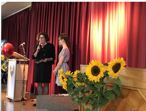
Die erste Abschlussfeier