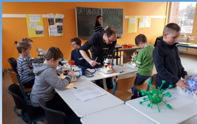
Schnuppern bei den Naturwissenschaften