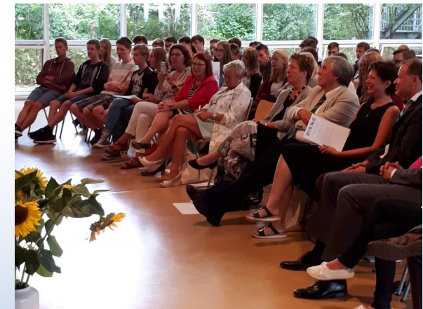
Eröffnung der Oberstufe

Im Sommer 2019 wird zum achten Mal ein neuer Jahrgang an der IGS eingeschult. Auch dieses Mal können die Bläser- oder die Kunstklasse ausgewählt werden.