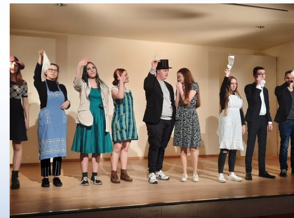
Vorstellung im „Kulturforum“ 2020

Die Schüler*innen lernen gemeinsam und auf ihre persönlichen Schwerpunkte ausgerichtet. Dadurch wurden in den vergangenen Jahren viele gute Abschlüsse erreicht.