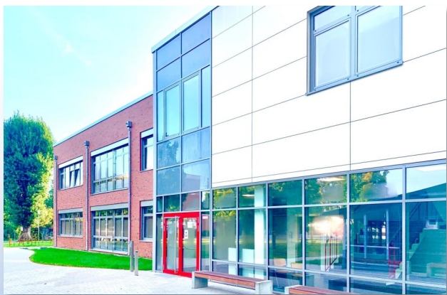
Das neue Lernhaus für die Oberstufe

bei allen Schulveranstaltungen ein Highlight. Ein attraktives Angebot stellt die Kunstklasse dar. Die IGS Lilienthal ist als Umweltschule, sportfreundliche Schule und mit dem Prädikat „Pro Berufsorientierung“ ausgezeichnet worden.